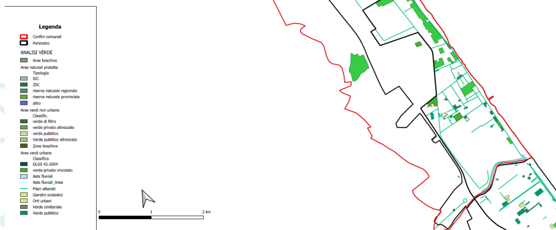
Città lineare adriatica costiera Alba Adriatica